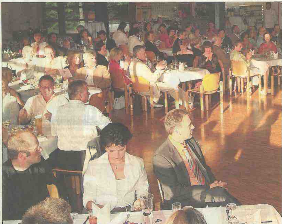
Schon bisher waren die Feiern der Schreiner Innung gut besucht. Jetzt wird gemeinsam mit weiteren Innungen und Partnerorganisationen ein Festival organisiert.